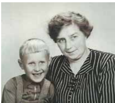
Timo och Mor strax före avresan till Finland 1946. Från familjealbumet

Far var som nämnts engagerad i den kommunala politiken och vår mor var starkt involverad i politiken på regional och även på riksnivå, som