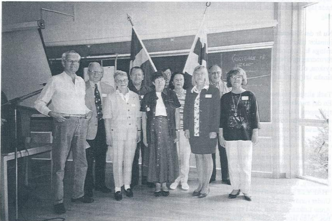
Den nyvalda styrelsen fotograferad på årsmötet i Kungälv

tillönskar styrelsen alla RFK:s medlemmar